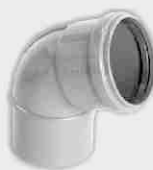
Codo Macho-Hembra Junta Elástica 67° 30'