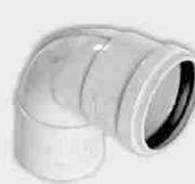
Codo Macho-Hembra Junta Elástica 87° 30'