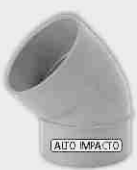
Codo Macho-Hembra Alto Impacto 45°