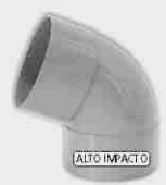
Codo Macho-Hembra Alto Impacto 67° 30'