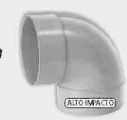
Codo Macho-Hembra Alto Impacto 87° 30'