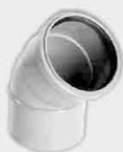
Codo Macho-Hembra Junta Elástica 45°