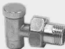
Escuadra Soldar Vitón