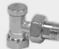
Escuadra Macho Compresión