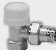
Escuadra Roscar Termostática