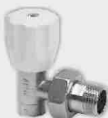
Escuadra Soldar Vitón