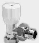
Escuadra Macho Compresión