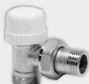
Escuadra Compresión Termostática