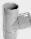
Injerto Simple Macho-Hembra 67° 30'