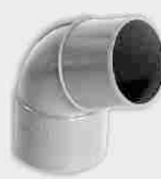
Codo Macho-Hembra 67° 30'