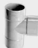
Injerto Simple Macho-Hembra 87° 30'