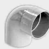
Codo Macho-Hembra 87° 30'