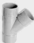
Injerto Simple Macho-Hembra 45°