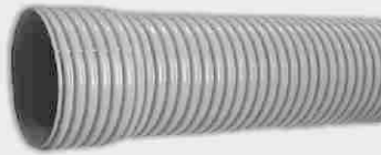
Tubo Corrugado Doble Pared Teja SN-8