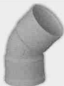
Codo Hembra-Hembra 67° 30'