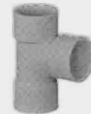
Injerto Simple Hembra-Hembra 87° 30'