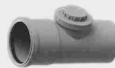
Manguito Dilatación Registrable Macho - Hembra