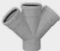
Injerto Doble Plano Macho-Hembra 45°