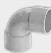
Codo Hembra-Hembra 87° 30'