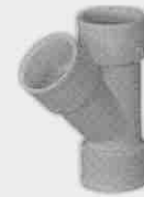
Injerto Simple Hembra-Hembra 45°