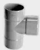
Injerto Simple Macho-Hembra 87° 30'