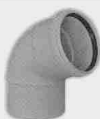
Codo Macho-Hembra 67° 30'