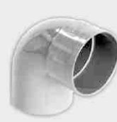
Codo Macho-Hembra 87° 30'