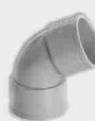
Codo Hembra-Hembra 67° 30'