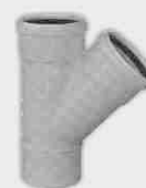
Injerto Simple Macho-Hembra 45°