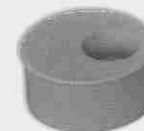
Tapón de Reducción

El Manguito de Dilatación Registrable puede instalarse tanto en posición horizontal como vertical.