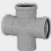
Injerto Doble Plano Macho-Hembra 87° 30'