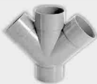
Injerto Doble Plano Macho-Hembra 45°