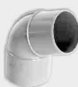
Codo Macho-Hembra 67° 30'