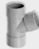
Injerto Simple Hembra-Hembra 67° 30'