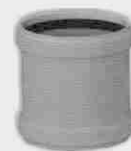
Manguito Dilatación Hembra - Hembra