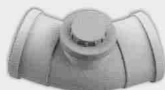
Codo Registrable Hembra-Hembra 45°