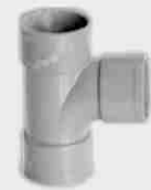
Injerto Simple Hembra-Hembra 87° 30'