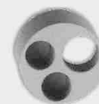
Tapón de Reducción Triple Ciego