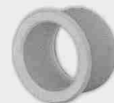
Casquillo de Reducción