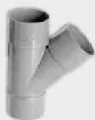
Injerto Simple Macho-Hembra 45°