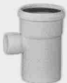
Injerto con Reducción Macho-Hembra 87° 30'