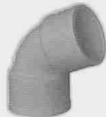
Codo Hembra-Hembra 45°

Los tubos de diámetro 40 y 50 se suministran sin embocadura. Para diámetro 250, consultar.