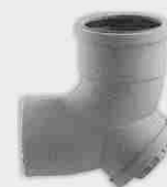
Conexión Bajante Registrable Macho-Hembra 87° 30'