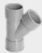
Injerto Simple Hembra-Hembra 45°