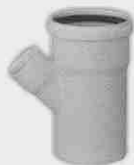
Injerto con Reducción Macho-Hembra 45°