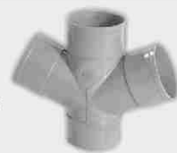
Injerto Doble Plano Macho-Hembra 67° 30'