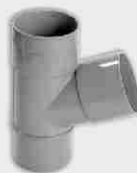
Injerto Simple Macho-Hembra 67° 30'