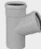
Injerto Simple Macho-Hembra 87° 30'