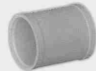
Manguito de Unión Hembra-Hembra