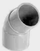
Codo Macho-Hembra 45°