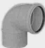
Codo Macho-Hembra 87° 30'