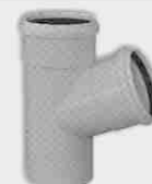
Injerto Simple Macho-Hembra 67° 30'