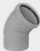
Codo Macho-Hembra 45°