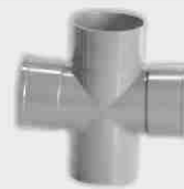
Injerto Doble Plano Macho-Hembra 87° 30'