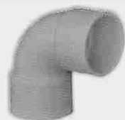
Codo Hembra-Hembra 87° 30'