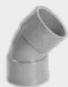
Codo Hembra-Hembra 45°